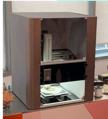
銀髮族的智能廚房