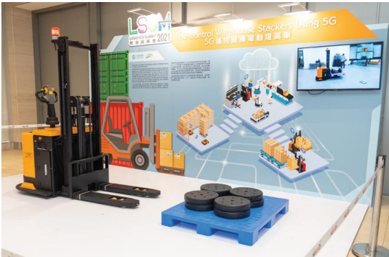
5G遙控倉庫電動堆高機