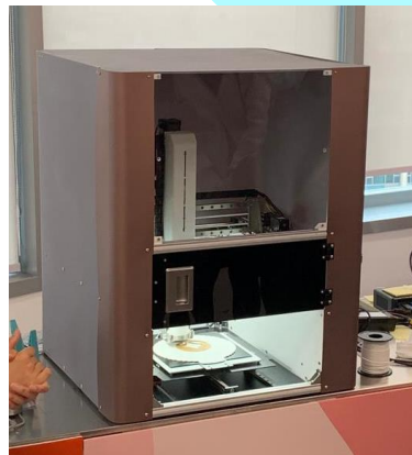
銀髮族的智能廚房