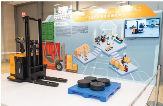
5G遙控倉庫電動堆高機