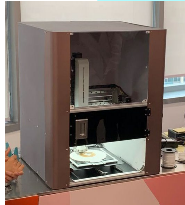
銀髮族的智能廚房